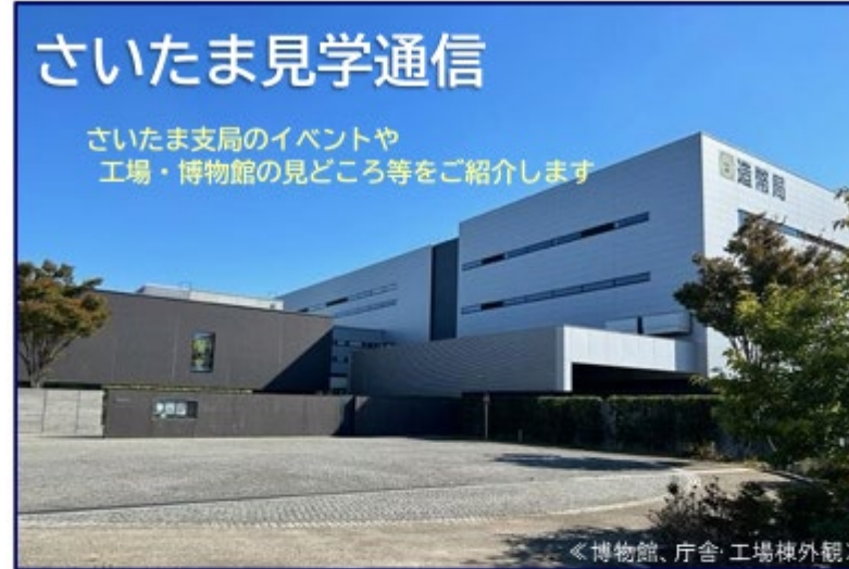
〈博物館、庁舎・工場棟外観〉

造幣局は、品質マネジメントシステムの国際規格「ISO9001」認証と環境マネジメントシステムの国際規格「ISO14001」認証を取得しています。